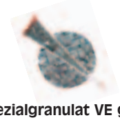
Spezialgranulat VE groß

KSF FEL 140 x 1400 - 2000 KSF FPL 140 x 1400 - 2000 KSF FPK 140 x 850 - 1400