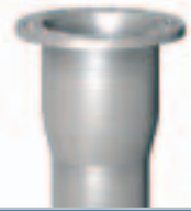
KSF FP/FE 140