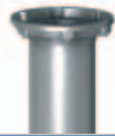
KSF FE 140